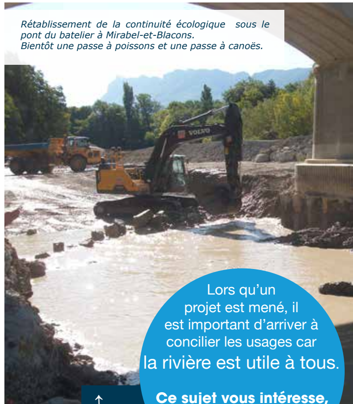
Rétablissement de la continuité écologique sous le pont du batelier à Mirabel-et-Blacons. Bientôt une passe à poissons et une passe à canoës.

Plus d'info : demander le guide de déclinaison du SAGE «Continuité écologique» à télécharger aussi sur www.riviere-drome.fr rubrique «Documents/le SAGE/ Plaquettes de synthèse»