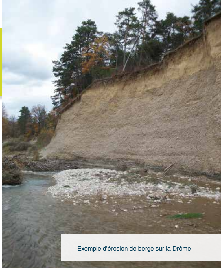
Exemple d'érosion de berge sur la Drôme

En cas d' érosion , la rivière emporte une partie des berges et les terrains s'en trouvent réduits. L'érosion est un élément essentiel du bon fonctionnement d'un cours d'eau (recharge sédimentaire, diversité des milieux, dissipation de l'énergie des crues, ...), mais elle peut poser problème en cas d'enjeux présents en berges.