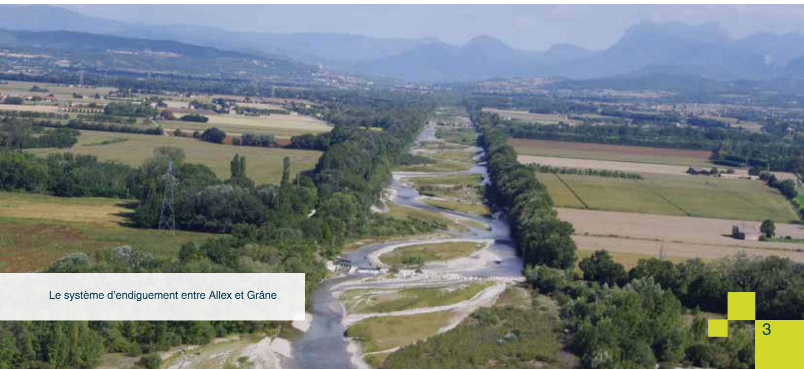
Le système d'endiguement entre Alex et Grâne

A ce jour, cette procédure est enclenchée sur les digues prioritaires de Livron et de Loriol.