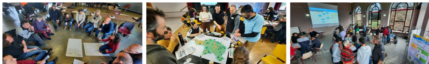
Figure 3 : Retours en image sur les concertations

Et plus récemment, la rédaction des dispositions du SAGE s'est réalisée avec les commissions thématiques (2025).