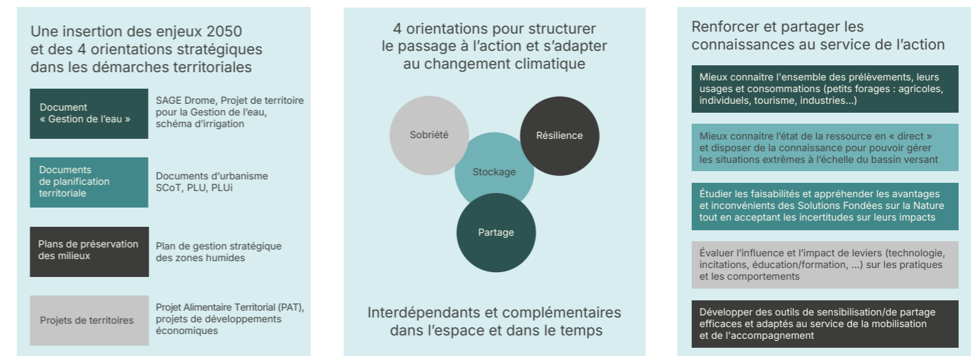
Figure 4 : Schéma des grands principes d'interventions autour des 4 axes : sobriété, résilience, partage et stockage