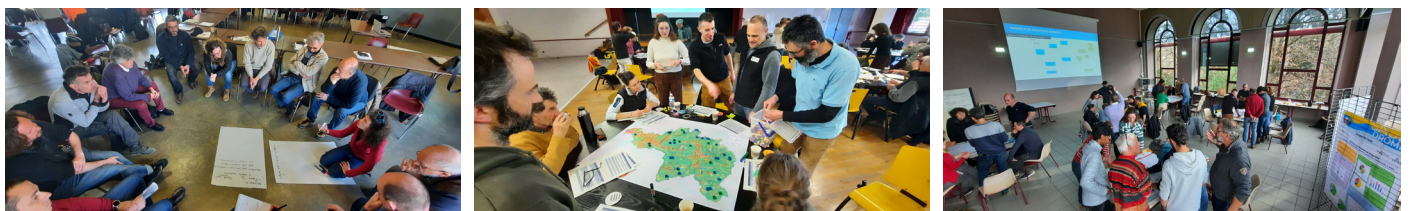
Figure 3 : Retours en image sur les concertations

Et plus récemment, la rédaction des dispositions du SAGE s'est réalisée avec les commissions thématiques (2025).