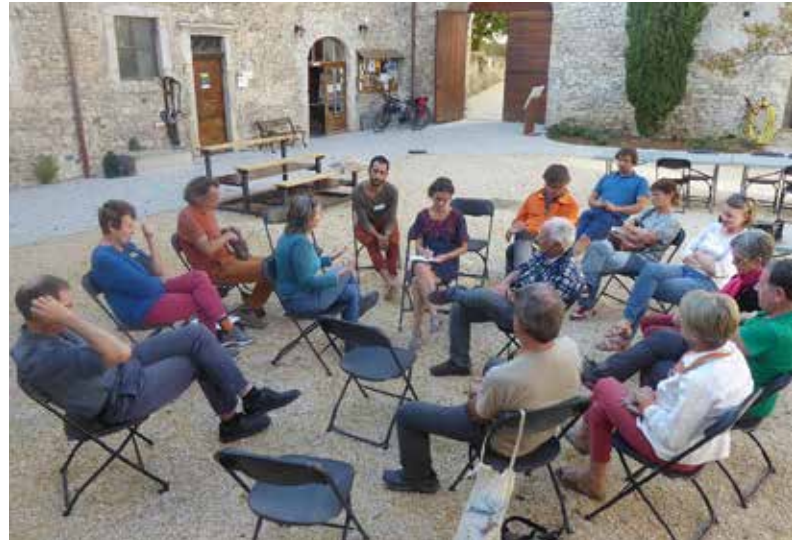
Restitution du projet SPARE au monastère de Sainte Croix : débat mouvant du 13/10/18

Depuis le 4 octobre 2018, une étape de concertation lors de la révision des SAGE est devenue obligatoire. Convaincue de l'intérêt de travailler avec les citoyens, la CLE y voit l'opportunité de vous solliciter à nouveau.